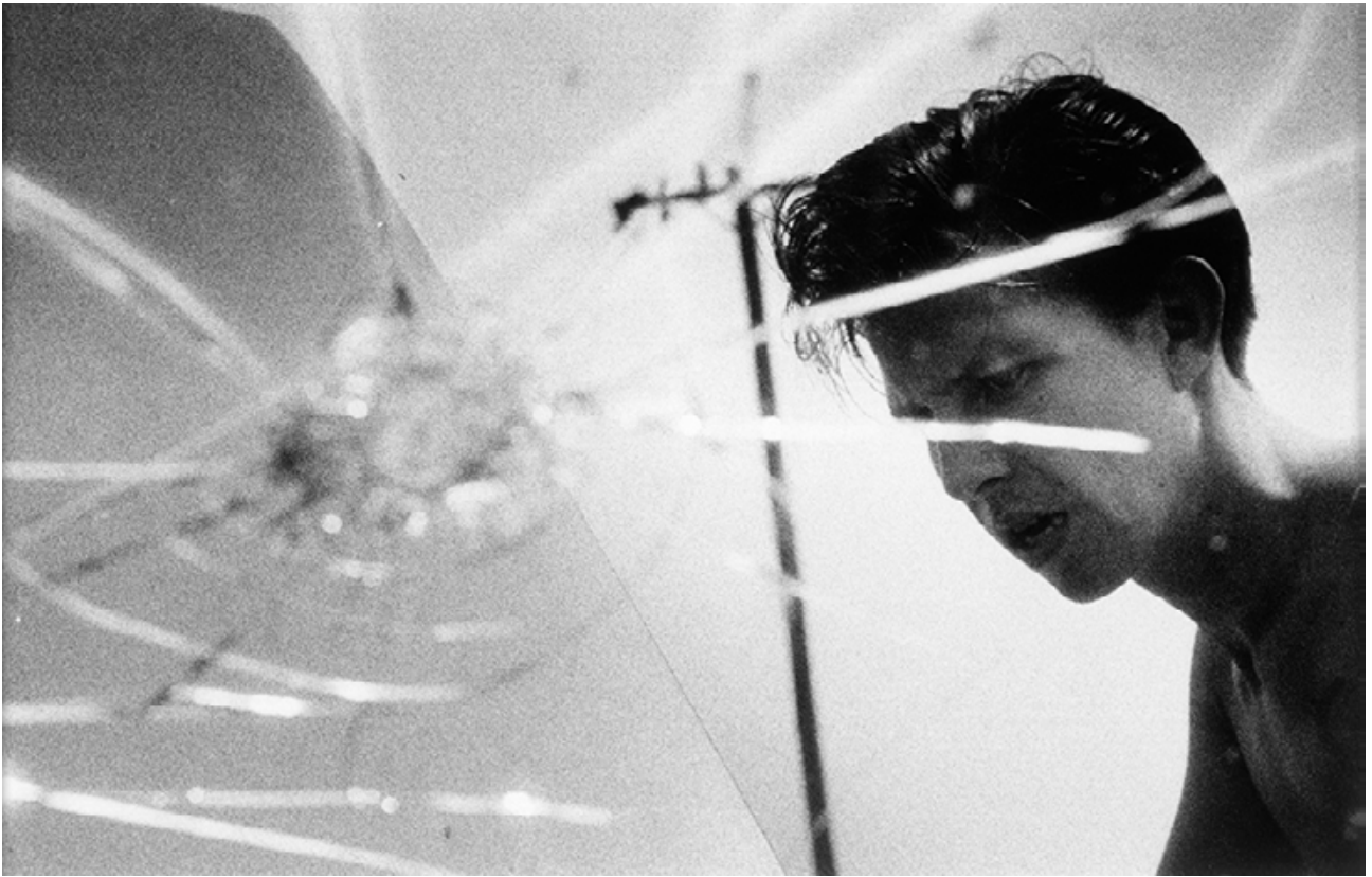
Fig. 03. Untitled, 1963, Larry Clark (1943), Black and white photography, 11 x 14 inches (27,94 x 35,56 cm)