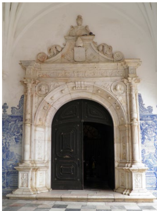
Fig.2 · Pórtico da igreja do convento de S. Bernardo. 1538, mármore.

Logo em 1857, no inventário do convento, é destacada a sua magnífica construção, com capacidade para cerca quarenta religiosas, para além das criadas da ordem e particulares (A.N.T.T., A.H.M.F., Cx. 2013). A casa religiosa seria extinta apenas em 1878, quando faleceu a última religiosa, instalando-se aqui, no ano seguinte, o seminário diocesano. Entre 1880 e 1887 o edifício serviria de instalações para um liceu e, a partir de 1911, albergou o Regimento de Caçadores n.º 1 ficando afecto, desde então e até ao presente, ao Ministério da Defesa. O próprio Museu Municipal ainda se instalou na antiga igreja monástica, entre 1932 e 1961, data em que passou para o edifício onde se encontra actualmente.