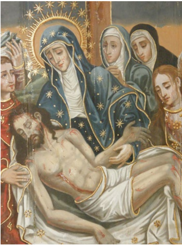
Fig.2 · Lamentação sobre Cristo Morto , séc. XVII, óleo sobre madeira, Museu Municipal de Portalegre, MMP.0068/0008.P

Lisboa. Após ter visitado o extinto convento de Santa Clara e examinado os objectos ali existentes, concluiu que não apresentavam “merecimento artístico ou de valor histórico, que merecesse ser recolhido no Museu de Belas Artes e Arqueologia” (A.N.T.T., A.H.M.F., Capilha 4).